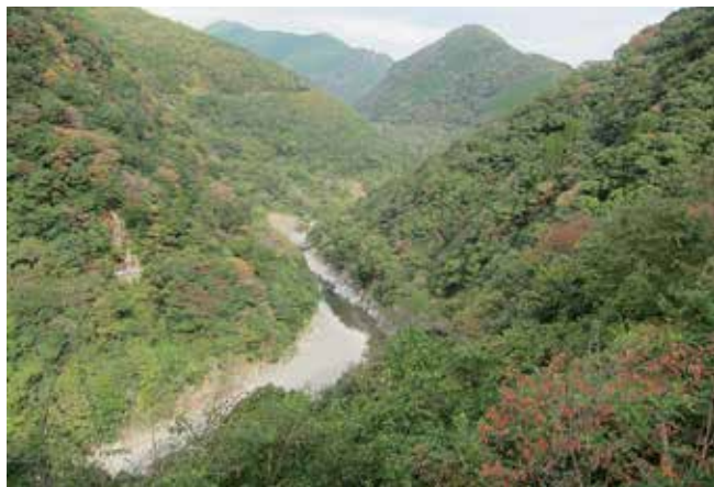
従来のダム計画地（川辺川藤田地区）

2020年7月4日の集中豪雨で球磨川が氾濫、球磨川・川辺川流域全体が被災、そして5カ月が過ぎました。今後の復旧、地域づくりのあり方には種々の方針、方向性が示され始めましたが、なぜかこの地の再興に治水Ⅱダム建設（穴あき）への再論議が性急になされ始めて、まだ身体も心も癒えてはいない被災した人たちの意欲の足かせになっています。先ずダム治水方式の論議や方策を最優先するのではなく、それに費やする時間とエネルギー、その予算は、次世代社会のための地域づくりが大事です。その一つとして、視点を変えた以下の構想を提案します。