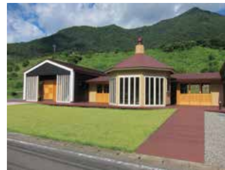
国立くまりばセンター・イメージ