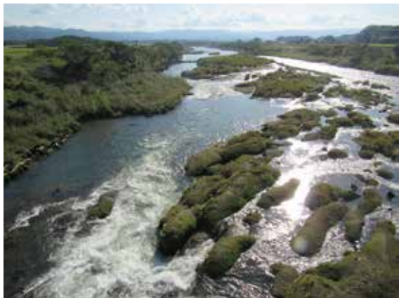
球磨川中流・堆積層