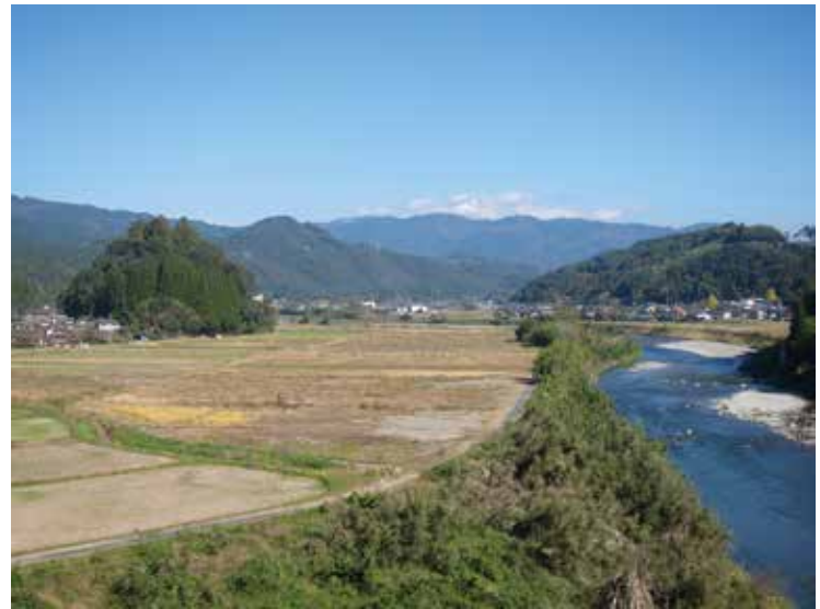
日本一の清流・川辺川中流域