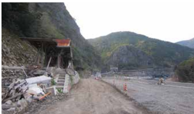
被災した球泉洞駅と清正公岩付近