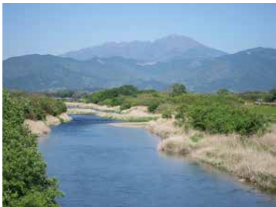
日本一の清流・球磨川上流域

皆様にお伝えしたいのは、母なる球磨川に学ぶとする「国立球磨川流域自然博物館」事業（仮称）及び「国立くまろびば・センター」施設（仮称）の提案です。まず地元の皆様へ提案をご読頂き、この国立球磨川流域博物館の設立イメージをより内容あるものにしたと存じます。勿論、この構想には自然災害へ備えとしての治水や治山も含めて、球磨川流域をより元の自